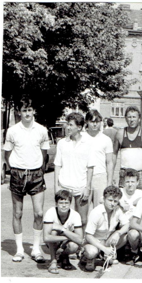
NOVÝ, MLADŠÍ TÝM ÚSTECKÝCH DOROSTENCŮ CHEMIČKY, KDE JINDE NEŽ VE ZNOJMĚ, TO BYLA „KOVÁRNA TALENTŮ“ A BALZÁM NA DUŠI (1990)